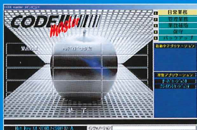
メインメニュー画面